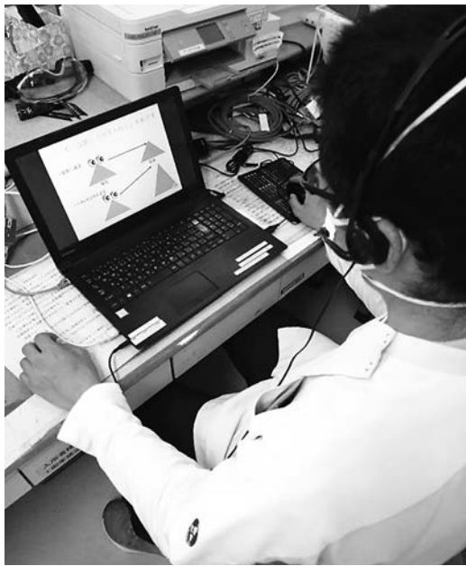
写真2 パソコンと携帯端末を利用したビデオ教材での受講