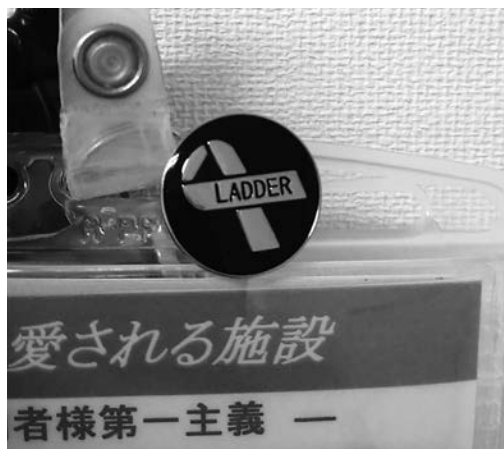
写真1 クリニカルラダー合格者に付与されるバッジ

介護クリニカルラダーとは、上尾中央医科グループ（AMG）の介護施設共通で実施している教育システムである。簡単に説明すると、レベルごとに研修カリキュラム（図表1）があり、それをすべて受講したうえで評価チェックリストの項目達成度を年度末に確認する。自己評価と上位者評価すべてにおいて、5段階評価（S・A・B・C・D）のA以上、かつラダー判定会議で問題なしと判断されれば合格となり、レベルに応じたバッジ（写真1）が付与される。レベル昇格は1年につき1段階までである。