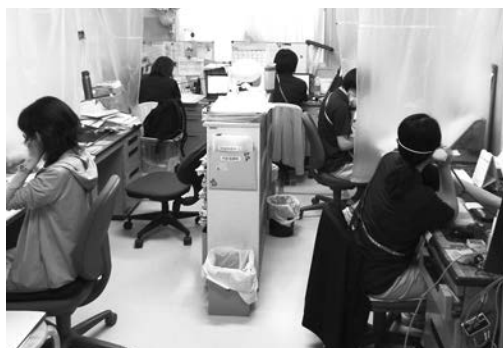
写真1 電話対応業務の様子

入所・ショートステイを担当しているSWの業務内容は、各事業所への営業（訪問・FAX）、相談（面談）業務、施設内入所検討会の開催、入所・ショートステイの日程調整、入所・ショートステイにかかわる送迎（添乗・運転業務）、入所時の立ち会い、入所者の病院受診・入院調整（送迎）、AMG地域連携会やAMG SW研修会への参加等が挙げられる。今回はその仕事を一部紹介する。