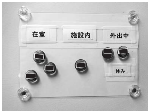
写真2 相談員所在掲示板

ることはもちろん、老健とはどのような施設かというご質問や、ご家族からは「当施設に連絡すれば介護の相談に乗ってくれると聞いた」、「介護サービス自体について教えてほしい」、「遠方にいる親をこちらで見たい」等がある。