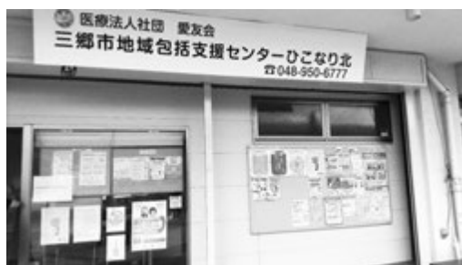
写真1 ひこなり北 外観