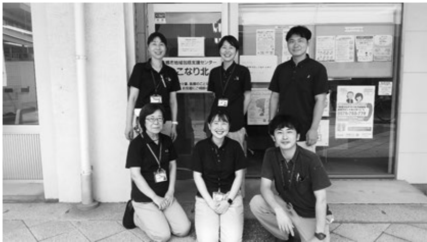
写真3 ひこなり北の職員