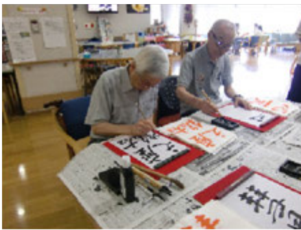
体以外の体操も大切

三郷ケアセンターの短時間リハビリが誕生して早くも一年が過ぎました。開始時は一枠の定員が4名でしたが、今年の6月より定員数が8名に増え、時間も75分から90分に延長されました。以前は要介護の方の利用が多かったのですが現在は要支援の方の利用も増えています。要支援の方には身体機能に合わせた自主トレや集団のリハビリを行っています。要介護の方には個別リハビリの提供を行い各々の目標を目指し、皆様と一緒に頑張っています。ぜひ、一度見学に来て下さい。