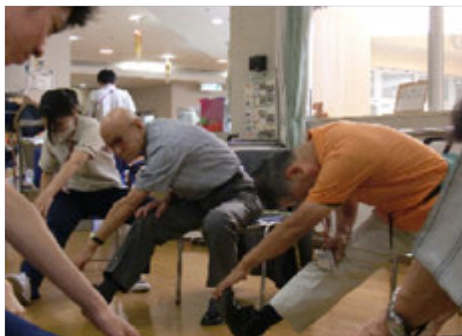
家でも出来る体操