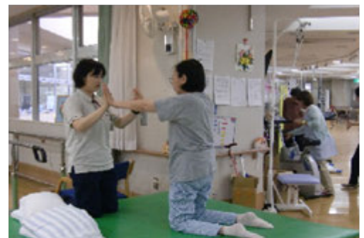
レベルに合わせた個別リハ