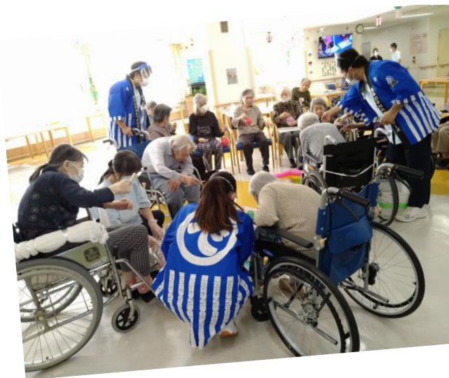
👉 納涼祭 👈